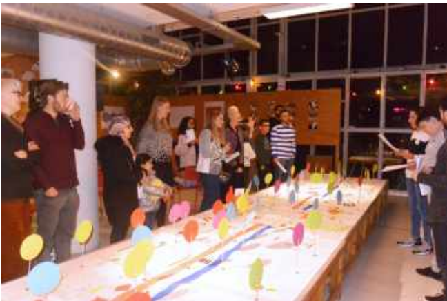
Eindpresentatie Blok 1 Studio Osdorperban. 2019

Twee onderdoorgangen van de Osdorperban naar de achterliggende straat waren al vele jaren een hoofdpijndossier voor het stadsdeel vanwege hangjongeren en illegale praktijken die er plaatsvonden. Op verzoek van het stadsdeel maakte The Beach er in de zomer van 2019 een programma met een afsluitend Straatmakers Festival in september. Wij grepen de gelegenheid aan om contacten te leggen en relaties te verdiepen in de buurt, vooral met jongeren. Het werd de opstap naar een nieuw project Studio Osdorperban.