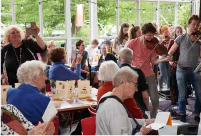
Vrijheidsfestival 5 mei met Ricciotti Ensemble. Foto Steven van Eck, 2019