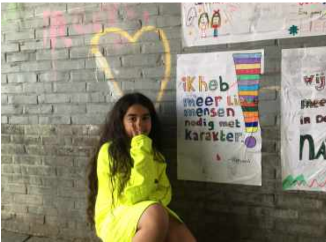
Workshop wildplakken in de onderdoorgangen van de Osdorperban.

Naast een groeiend kookcollectief werd de Wilde Chefs een belangrijk knooppunt voor culturele initiatieven in de buurt, zoals deelname aan Vrouwen van Nieuw-West met zichtbaarheid in de hele stad door de reizende fototentoonstelling in de publieke ruimte van het Amsterdam Museum en Pakhuis de Zwijger. De Wilde Chefs haalden met hun foto zelfs de voorpagina van het Parool PS. Ook vormden ze een belangrijke basis voor een nieuw maakcollectief van Nederlandse en Eritrese ontwerpers en makers: De Wilde Vlechters.