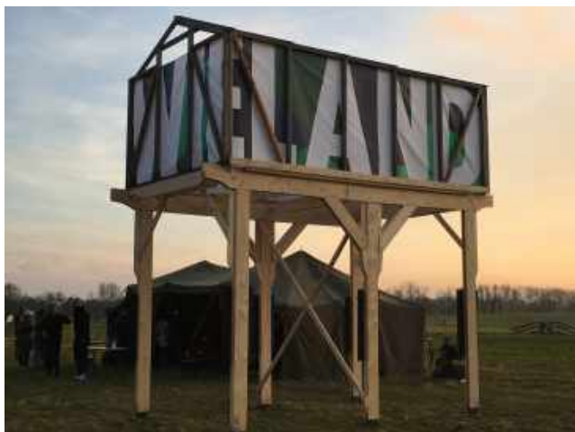
Lancing Wieland in de Tuinen van West.

Als logische aansluiting op het sociaal en duurzaam ontwikkelen van initiatieven in de wijken van Nieuw-West – waarin voedsel en gezondheid een belangrijk rol spelen – maakten we een begin met het maken van een eigen plek in de Tuinen van West: Broedplaats Wieland.