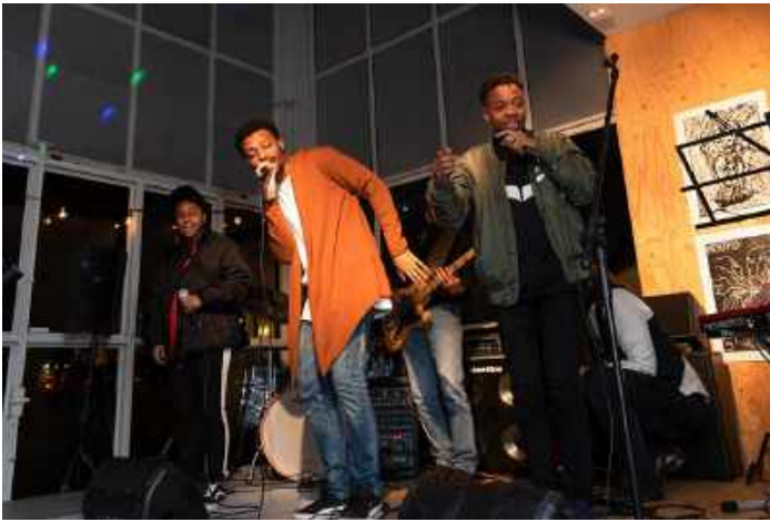
Power of Art event Shokkin' NL en DW-RS.

The Beach Lokaal, onze fysieke plek in de Garage Notweg, onze werkplaats en hub voor ontmoetingen met en tussen buurtbewoners tot internationale makers en onderzoekers, was ook in 2019 een cruciale factor in lokaal ingebed ontwerpen. We maakten er gebruik van voor programma's met nieuwe lokale deelnemers aan cultuurmaken op wijkniveau tot landelijk en wereldwijd geïnteresseerden in nieuwe benaderingen van vormgeven aan de leefomgeving. De combinatie van de plek en onze stevige relaties in de buurt bleken voor veel partijen aantrekkelijk. Ontwerpers en kunstenaars, onderzoekers en beleidsmakers wisten ons veelvuldig te vinden. Zo boden we onder meer ruimte aan de lancering van de Digitale Agenda van de stad tot een workshopprogramma met studenten uit Groningen.