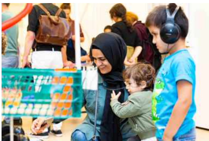
Presentatie ruimtelijk schetsontwerp Kindermuseum. Foto Nichon Glerum, 2019

Gezien de grote opgave en noodzaak tot vernieuwing op het gebied van beeldend maken en creatief maakonderwijs voor kinderen, gingen we hiervoor een strategisch samenwerkingsverband aan. The Beach was met de OBA Maakplaats en Waag initiatiefnemer van de Maakcoalitie Amsterdam om het belang jonge kinderen te betrekken bij beeldend creatief maken, in met name achterstandswijken, op de kaart te zetten en om verbindingen te maken met onderwijsinstellingen. The Beach werd uitgenodigd (en geselecteerd) voor de Pilot Cultuurcoach in 2020 die cultuureducatie in het basisonderwijs in Amsterdam de ruimte geeft en maakte een begin met een trainingsprogramma voor cultuurdocenten in het basisonderwijs.