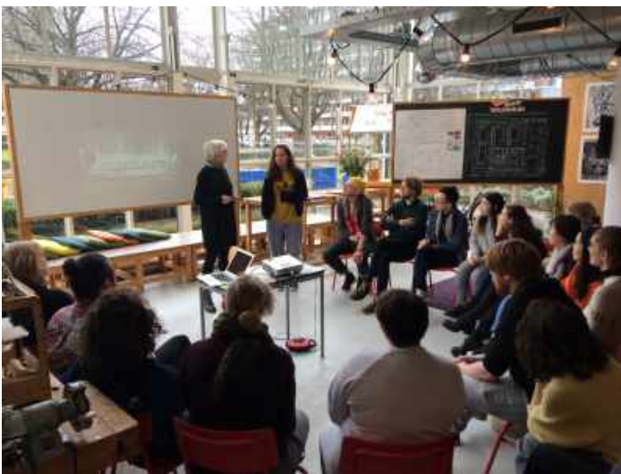
Workshop sustainist design i.s.m. STEIM met internationale groep studenten Prins Claus Conservatorium en Academie Minerva (NAIP / MADTECH programma).

Het strategisch belang van door The Beach ontwikkelde knowhow bleek ook uit de verbanden van ons ontwerp onderzoek met onderzoek van academici die beseffen dat aansluiting nodig is op sociale en culturele praktijken die voorlopen op de theorie. Zoals bijvoorbeeld het Straatwaarden-onderzoek van het Lectoraat van de erfgoedopleiding Reinwardt Academie waarmee een sprong werd gemaakt van statisch 'erfgoed' naar dynamisch 'erfgoedmaken'. The Beach bijdroeg daar aan bij met inzichten over lokaal ingebed co-design. Een ander voorbeeld is Confident Futures, een onderzoek in Amsterdam en New York naar een gezonde toekomst voor jongeren vanuit de faculteit medische antropologie van de Universiteit van Amsterdam.