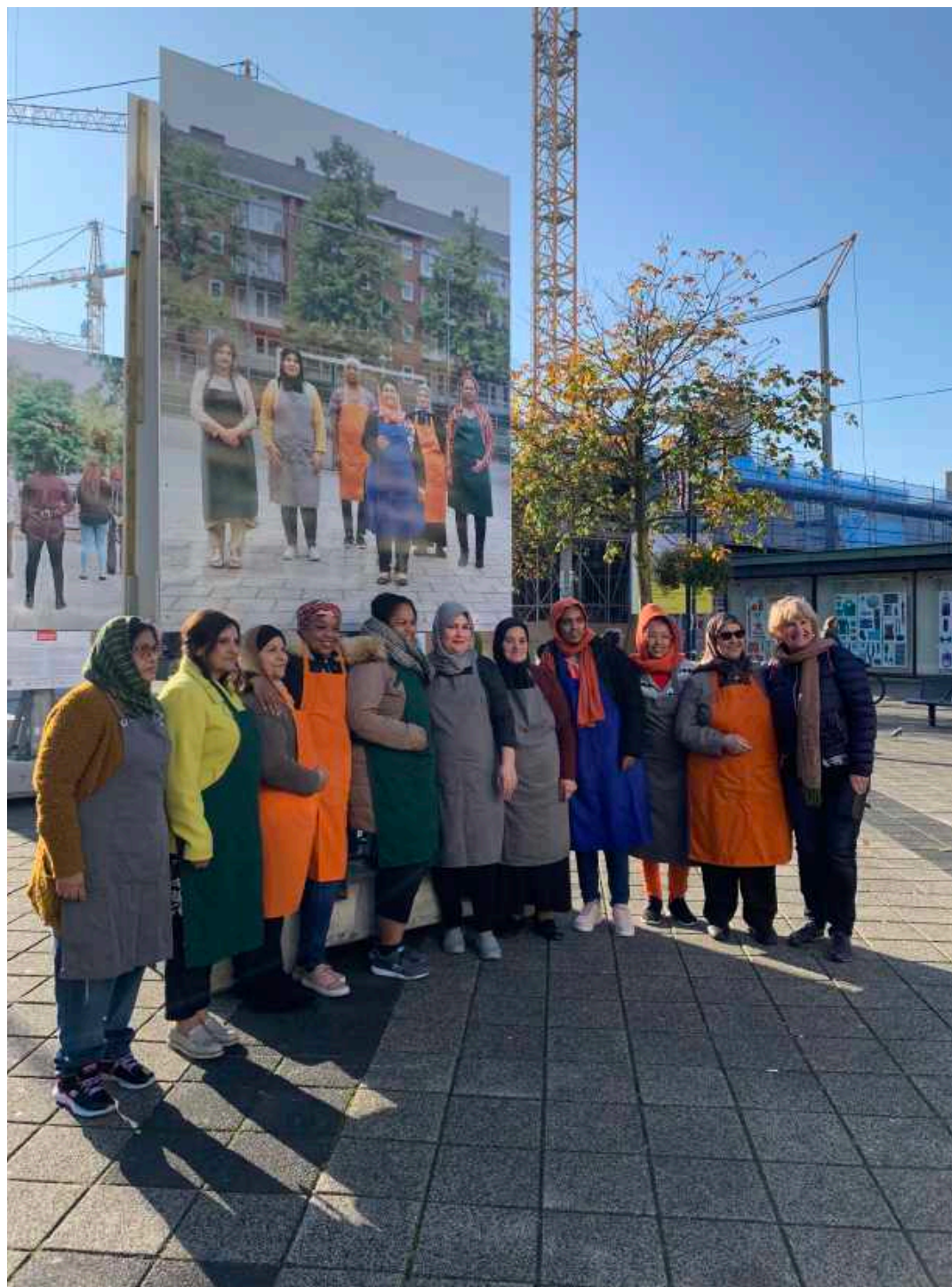
Wilde Chefs @ Vrouwen van Nieuw-West tentoonstelling Osdorppelein. Foto The Beach, 2019