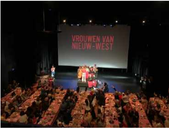
Wilde Chefs op het podium bij het door hen verzorgde diner in De Meervaart. Foto Peter Both, 2019