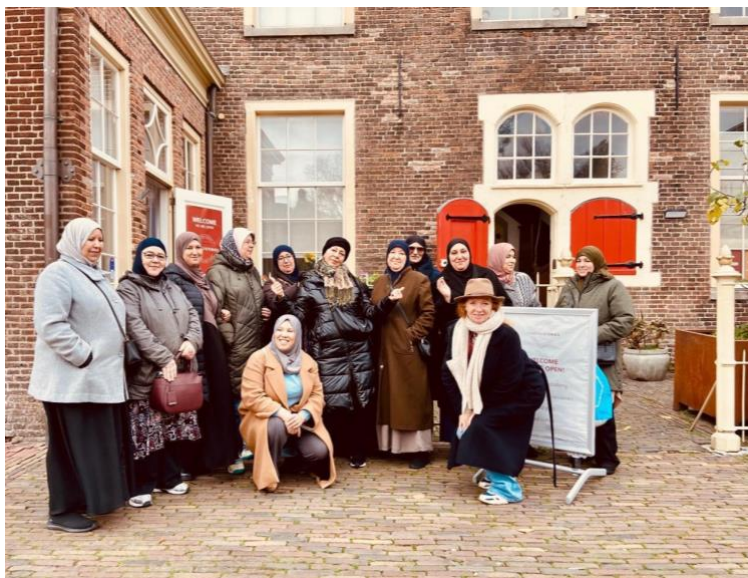
Foto: Locatiebezoek Crafted Stories. De producten van VJVM voor het eerst in de winkel!

De veiligheid binnen de groep bleef bij VJVM erg belangrijk. Door te werken in kleine groepen en de samenstelling van kundige begeleiding, werd een veilige omgeving gecreëerd waardoor de vrouwen zich prettig voelden en meer dingen durfden. Gaandeweg konden vrouwen zelf meer verantwoordelijkheden oppakken.