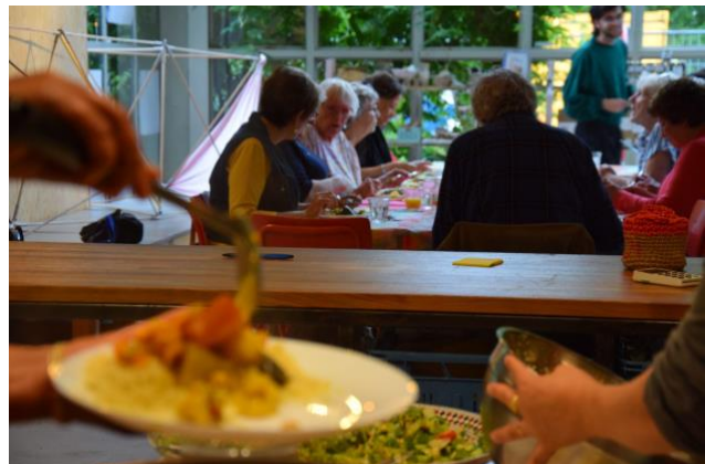
Voor jou, voor mij (VJVM)