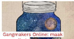
Gangmakers Online: maak een collage Met deze opdracht maak je een verrassende collage met plaatjes uit tijdschriften of kranten!