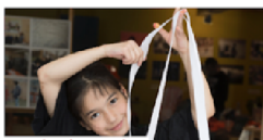
Inspiratie en tips Op deze pagina vind je nog meer inspiratie, tips en opdrachten die je thuis kunt uitvoeren.