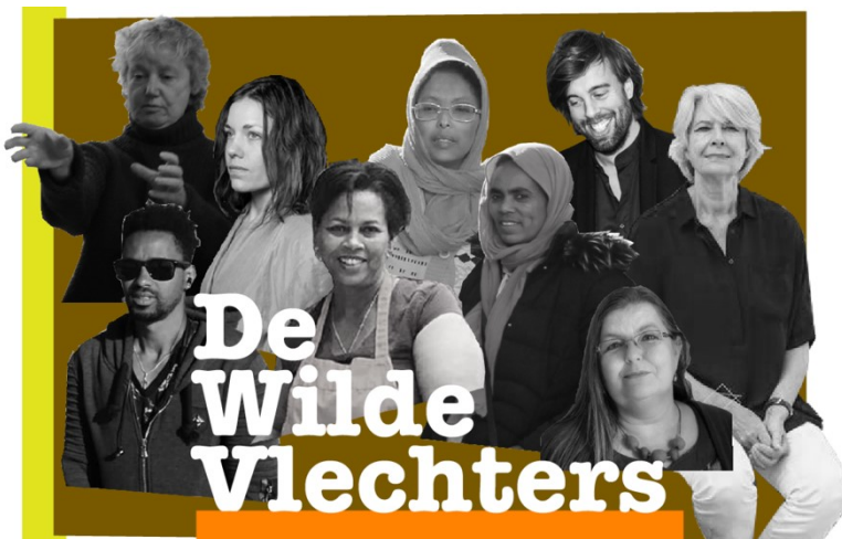
Wilde Vlechters team 2020.