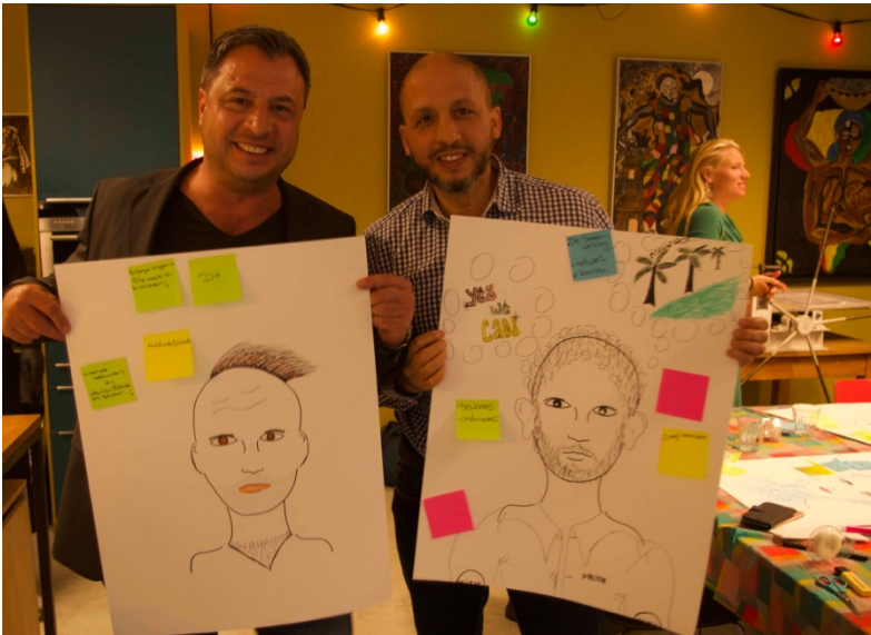
Workshop Zicht op Wildeman. Foto Olga Timmer, 2020

Professionals uit jeugdzorg, onderwijs, gemeente en politie die betrokken zijn bij de Wildemanbuurt zetten een belangrijke nieuwe stap. Tijdens een etentje bij de Wilde Chefs en een co-designworkshop onder leiding van The Beach ontwikkelden ze een integrale aanpak met ambitieuze plannen voor een positieve ontwikkeling van de buurt. Ze deelden hun perspectieven en spraken intenties uit om met bewoners, ondernemers en buurtinitiatieven te werken aan een buurt die groeit en bloeit.