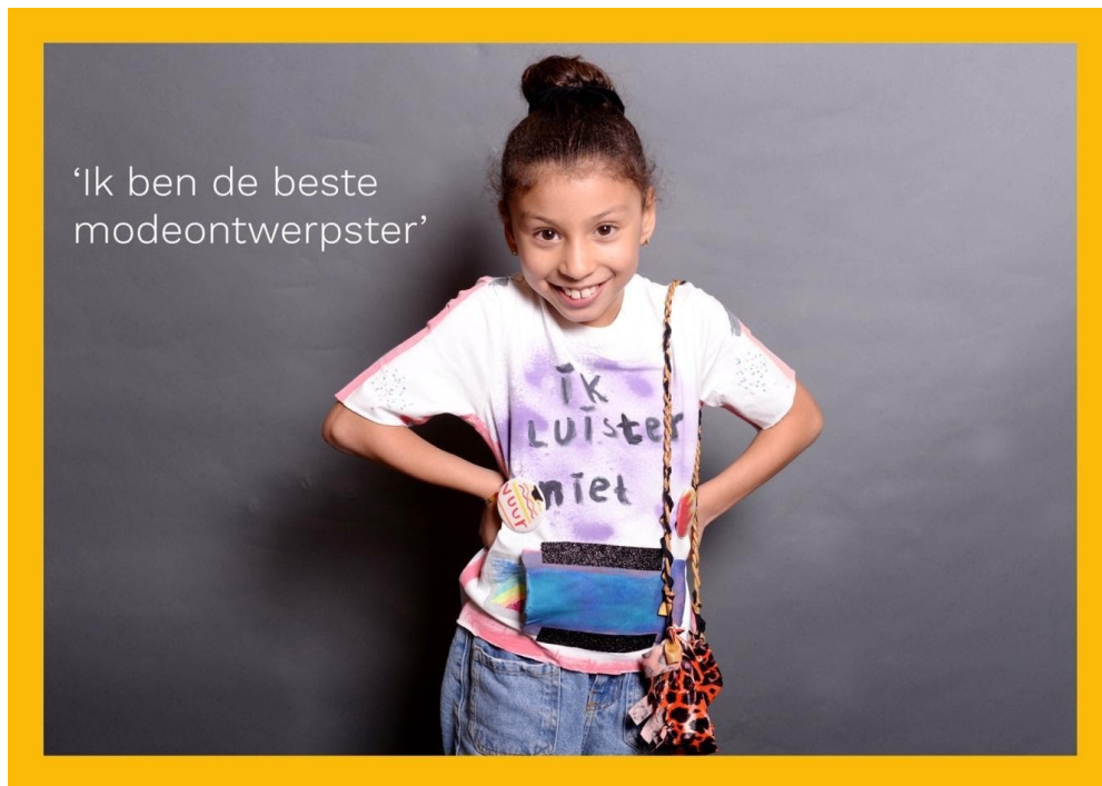
Een van de 15 ansichtkaarten van het Gangmakers Ontwerplab over mode. The Beach, 2020