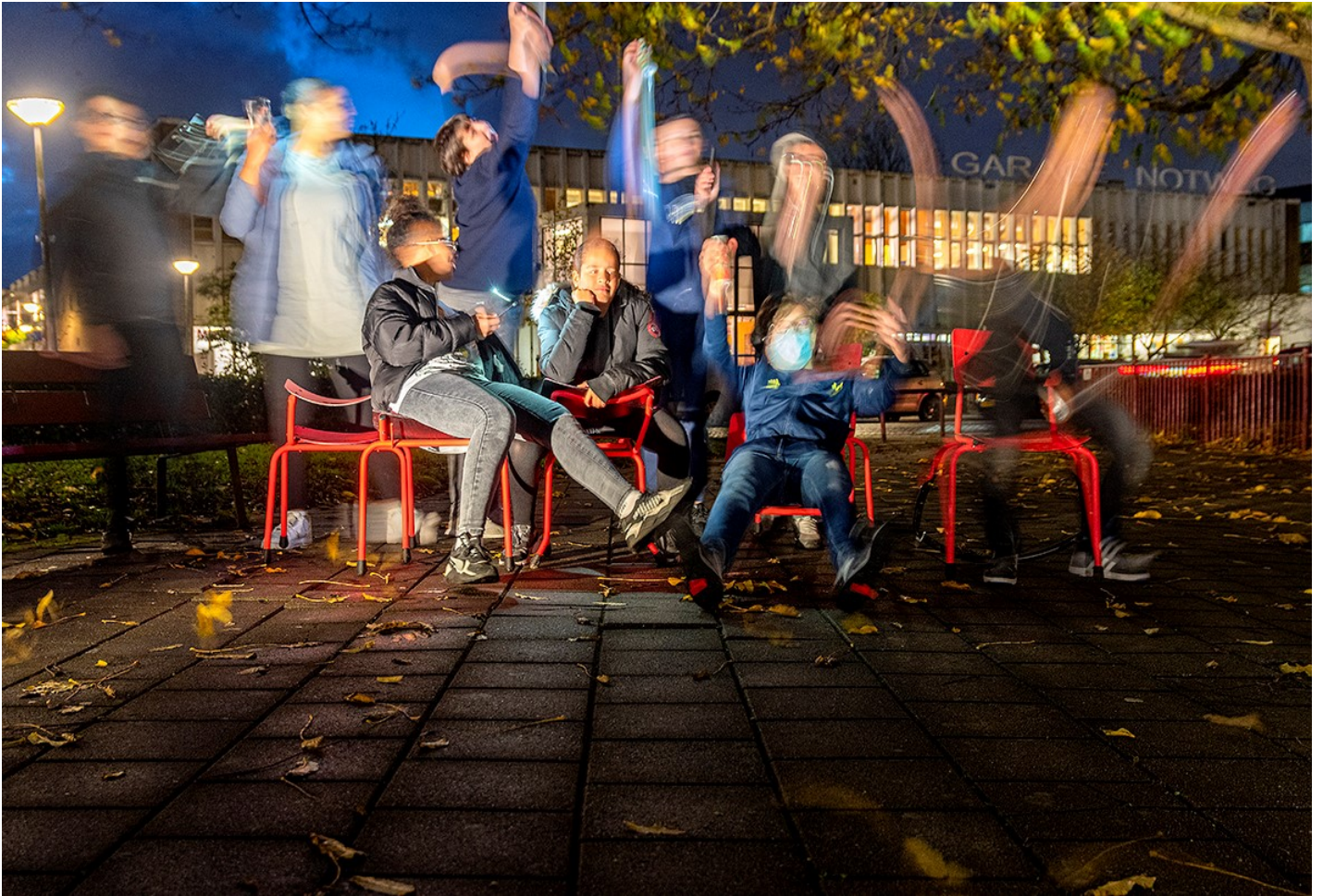
Studio Osdorperban fotoshoot. Foto Noud Verhave, 2020