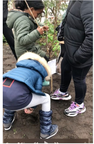
Wieland hek met oproep voor Plan je plan (links) en de eerste boom voor het voedselbos door kinderen van het Kinderpersbureau (rechts). 2020