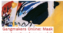
Gangmakers Online: Maak een kunstwerk op muziek We gaan schilderen en tekenen op muziek! Je gaat naar verschillende geluiden luisteren en dan...