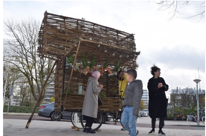
T uit West op het Slotterplas Festival en op op stap met de T-kar.

In de T-ateliers was er ruimte voor open gesprekken en ontstond vertrouwen tussen de deelnemers onderling en in het proces. Het thema van de eerste 1000 dagen verschoof naar het perspectief van de vrouwen zelf: de gezonde moeder en wie zij kunnen vertrouwen bij een gezonde start van hun kind. In korte tijd werd T uit West door de deelnemers gedragen en gepromoot. Op het Slotterplasfestival in september presenteerde T uit West zich met eigen T-melanges en werd de zelfgemaakte kleding met trots gedragen. Via hun eigen kanalen verkochten de vrouwen thee en melden zich nieuwe deelnemers. Sommige vrouwen zagen kansen om te gaan ondernemen.