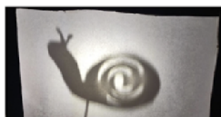
Gangmakers Online: Maak een schaduw theater Treed op in je eigen schaduw theater!