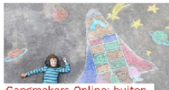
Gangmakers Online: buitenopdrachten Drie korte opdrachten om buiten mee aan de slag te gaan!