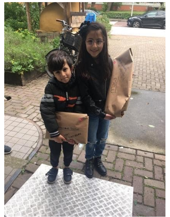
Gangmakers Online en Maakpakketten ophalen bij The Beach, Foto The Beach, 2020