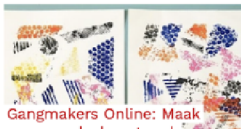
Gangmakers Online: Maak een recycle-kunstwerk Verzamel spullen die je anders weg zou gooien en verander ze in een kunstwerk!