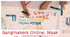
Gangmakers Online: Maak een elfje In deze opdracht ga je een elfje maken. Dit is een gedichtje van elf woorden. De letters in het...