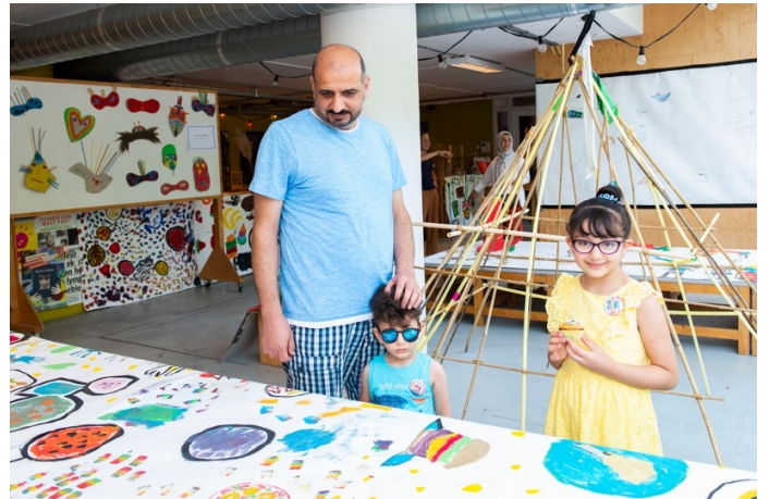
Eindpresentatie Gangmakers Buitenateliers. Foto's Vera Duivenvoorden, 2020