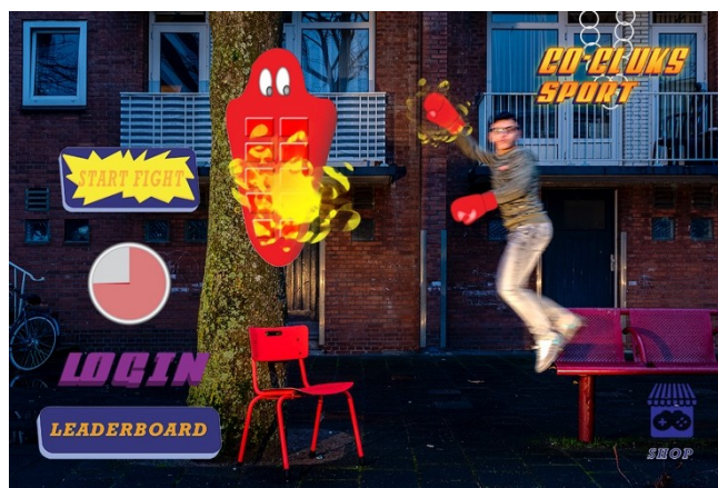
Ontwikkeling prototypes voor een serie stoelen om op te chillen en een game voor in de publieke ruimte.